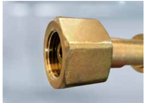
Anschlussmutter für andere Gase ohne Nut

Bei Brenngas-Flaschen weisen die unterschiedlichen Anschlüsse ein Linksgewinde auf. Bei allen anderen Gasflaschen besitzen die unterschiedlichen Anschlüsse ein Rechtsgewinde .