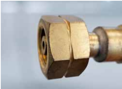
Anschlussmutter für Brenngase mit Nut