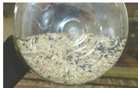
Vorratsschädlinge im Reis

Diese Angaben sind unverbindliche Werte zur Erklärung des Verfahrens, die Behandlung sollte immer durch einen dafür qualifizierten Fachmann festgelegt und begleitet werden.